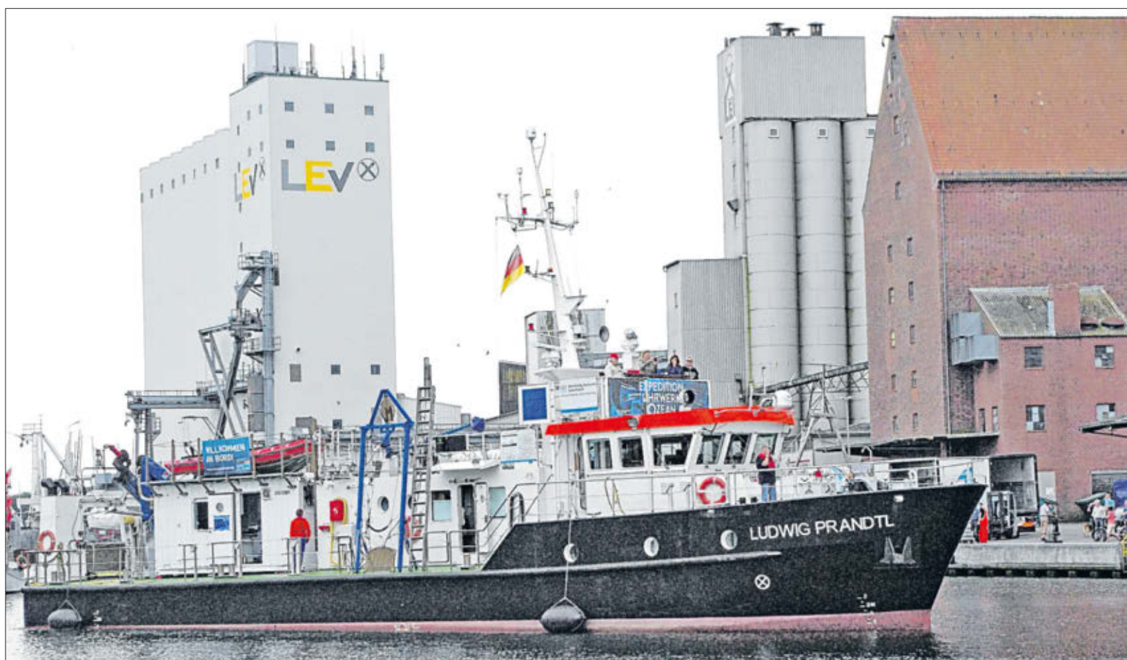
Die „Ludwig Prandtl“ geht in Heiligenhafener Kommunalfahrt vor der Fischhalle der Küstenfischer e.G. vor Anker.

KINO EUTIN» Cine Royal, Königstr. 1: 16.00 „Alice im Wunderland: Hinter den Spiegeln“; 16.00, 18.00, 20.00 „Ice Age 5 - Kollision voraus! 3D“; 18.00 „Monsieur Chocolat“; 20.00 „Erlösung - Flaschenpost von P“