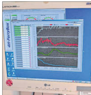
Auf diesem Monitor werden die Wasserwerte des Hafenbeckens in Heiligenhafen festgehalten: Die Qualität ist gut.

In Heiligenhafen präsentiert die Besatzung der „Ludwig Prandtl“ erstmals die Forschungsergebnisse, auch wenn sie für Untersuchungen der Ostsee häufiger in der Wardstadt vor Anker geht. Heute ist das Schiff, das vor der Fischhalle der Küstenfischer e.G. liegt, ab 13 und bis 19 Uhr für die Öffentlichkeit geöffnet. Für Kinder gibt es interessante Puzzles und Ratespiele. Die ersten Gäste kamen gestern bereits an Bord, als noch nichts vorbereitet war. Auch das ist Wissenschaft zum Anfassen.