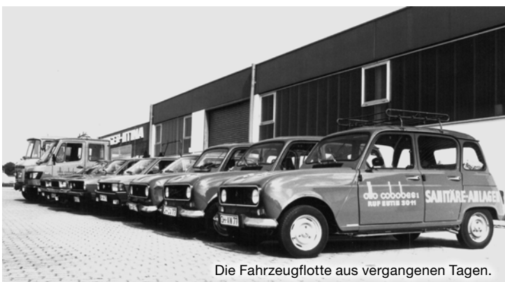
Die Fahrzeugflotte aus vergangenen Tagen.